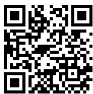
QR CODE แบบประเมินความเสี่ยง